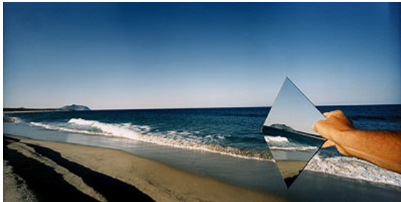
Mexico, 1996 (foto uit VISTA)