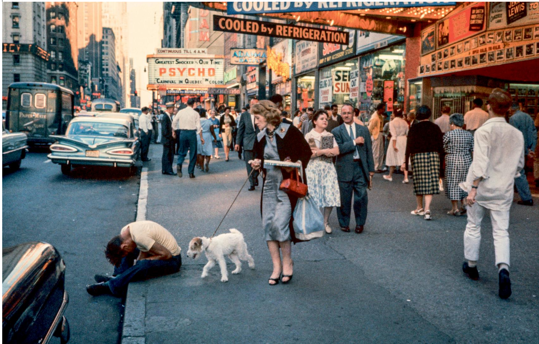
Man op 42nd Street, New York (1960)