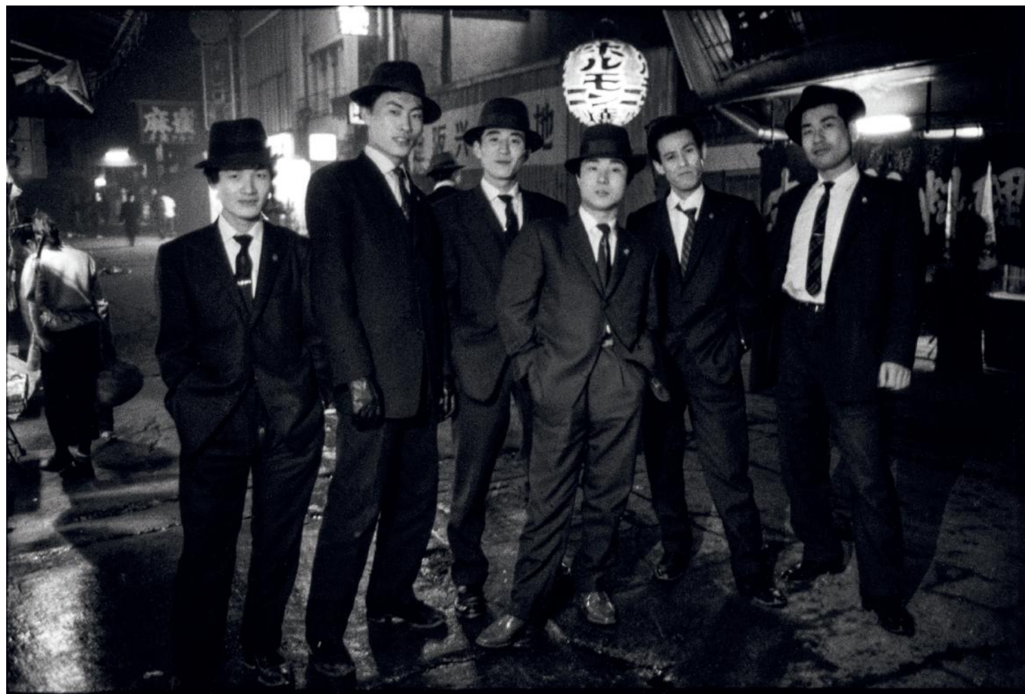
Japanse gangsters (yakuza) op straat, Kamagasaki, Osaka, Japan (1960)