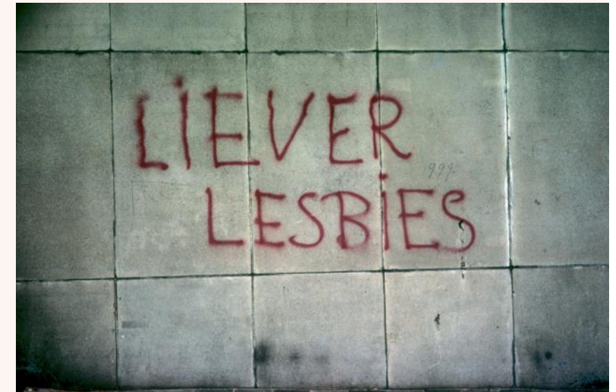
Muurtekst, Amsterdam (1975)