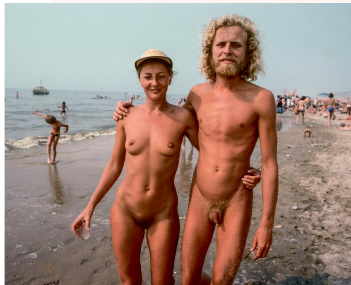
Naaktstrand, Zandvoort (1975)

99 Je ziet hoe leuk hij het allemaal vond