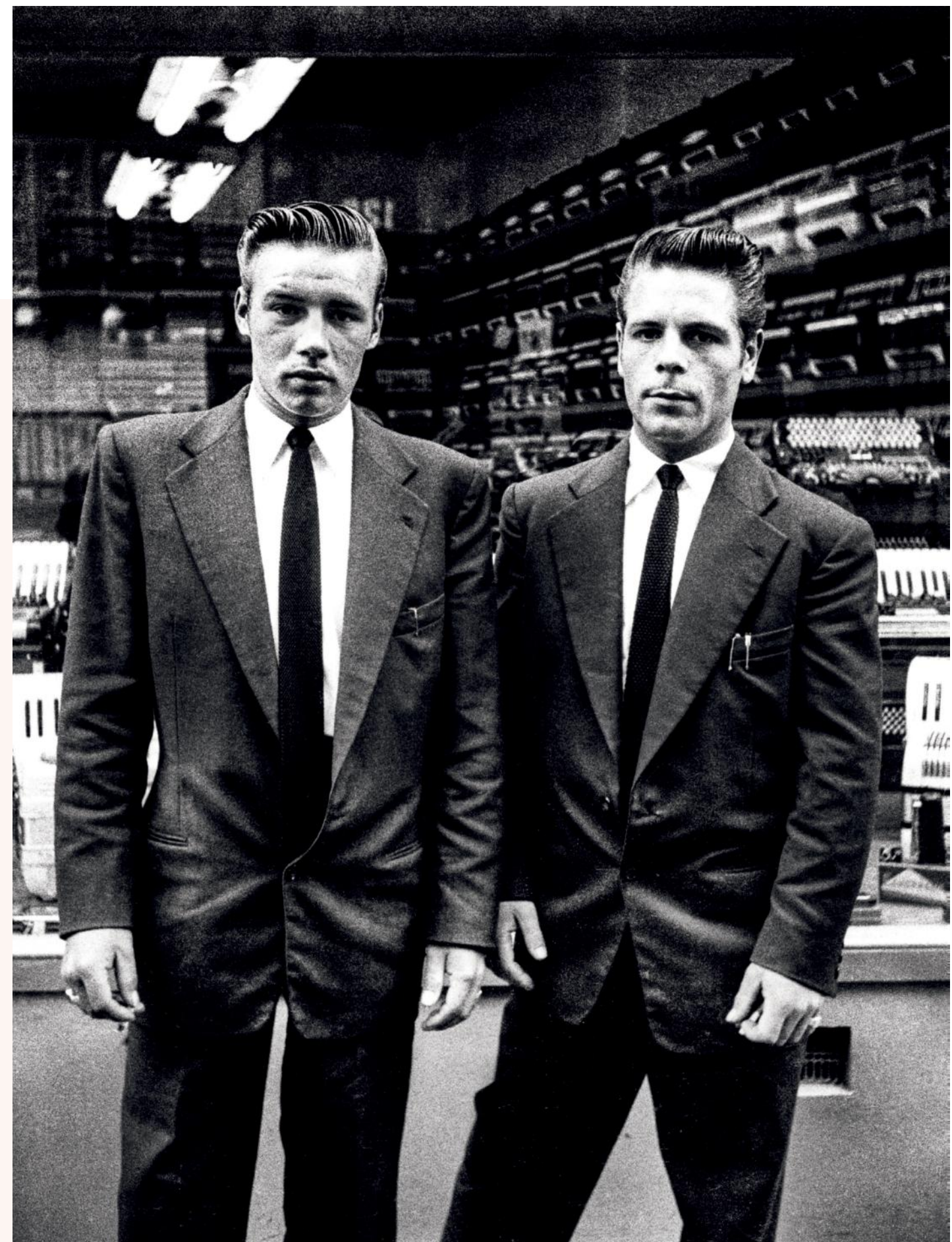
Nozems op de Nieuwendijk, Amsterdam (1955)

maakt, zegt de Bont, is dat de geportretteerden „niet betrappt zijn door de fotograaf, maar vol zelfvertrouwen en zonder angst de camera inkijken. Dit zijn echte straatportretten. Je voelt dat er een band is tussen de kunstenaar en zijn onderwerpen. Het is alsof de mannen de fotograaf hebben uitgedaagd om hen te fotograferen zoals ze gezien willen worden. Die persoonlijke betrokkenheid van de fotograaf was destijds nieuw en is te vinden in veel van zijn werk. Vooral de foto's die hij in de jaren vijftig in Parijs maakte, laten een sterke emotionele en sociale betrokkenheid zien en geven de kijker het gevoel er op dat moment bij te zijn.“