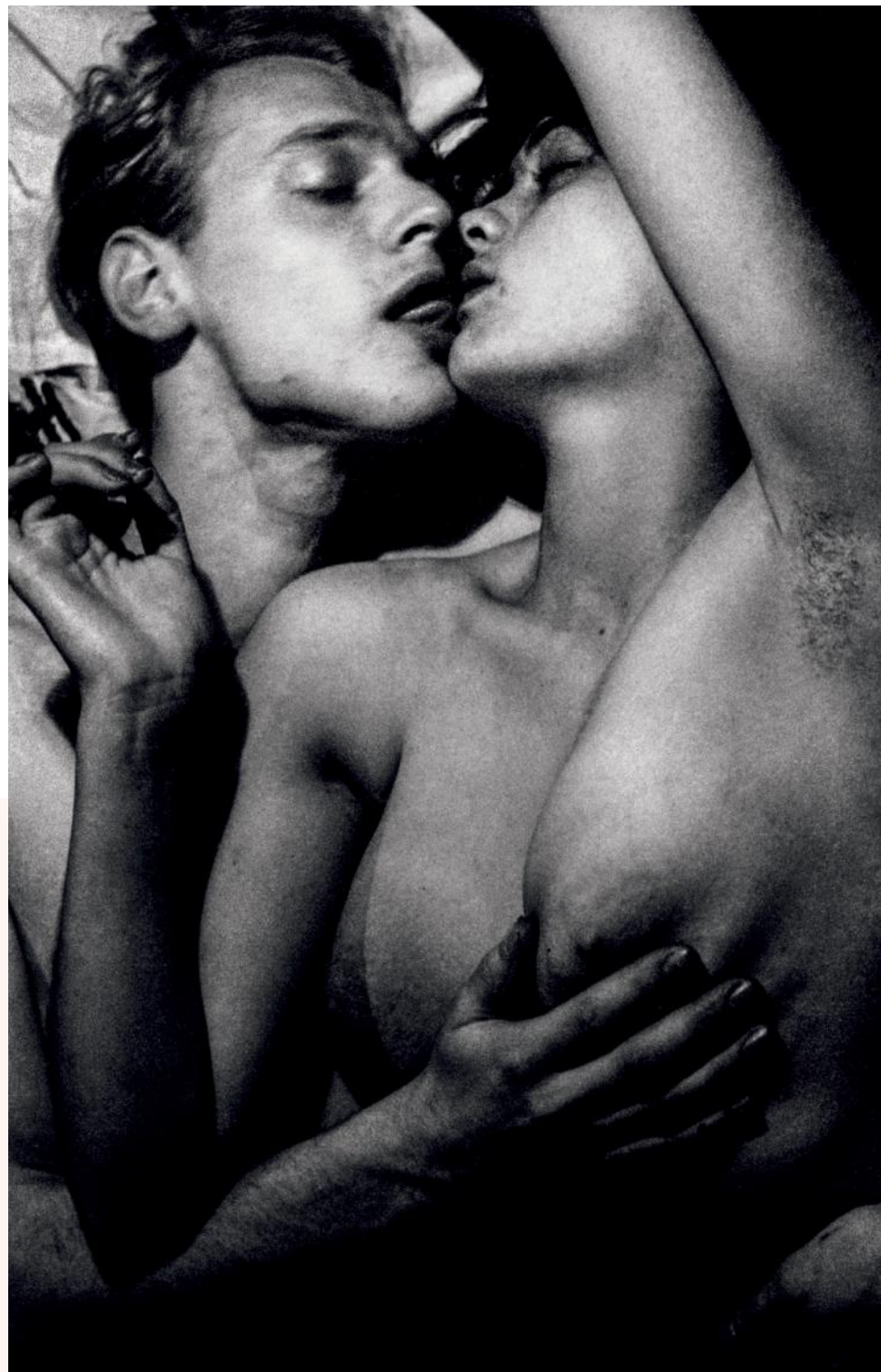
Simon Vinkenoog met vriendin, Parijs (1950)

Een favoriete Van der Elsken-foto van Nan Goldin is deze van dichter Simon Vinkenoog met zijn vriendin, in 1950 in Parijs. „Zijn foto's van omhelzingen zijn meer dan foto's. Dat is duidelijk te zien in deze opname. Het is alsof ik voor het eerst lichamen zie. Zo fysiek aanwezig, zo naakt. Het is alsof ik ze kan voelen.”