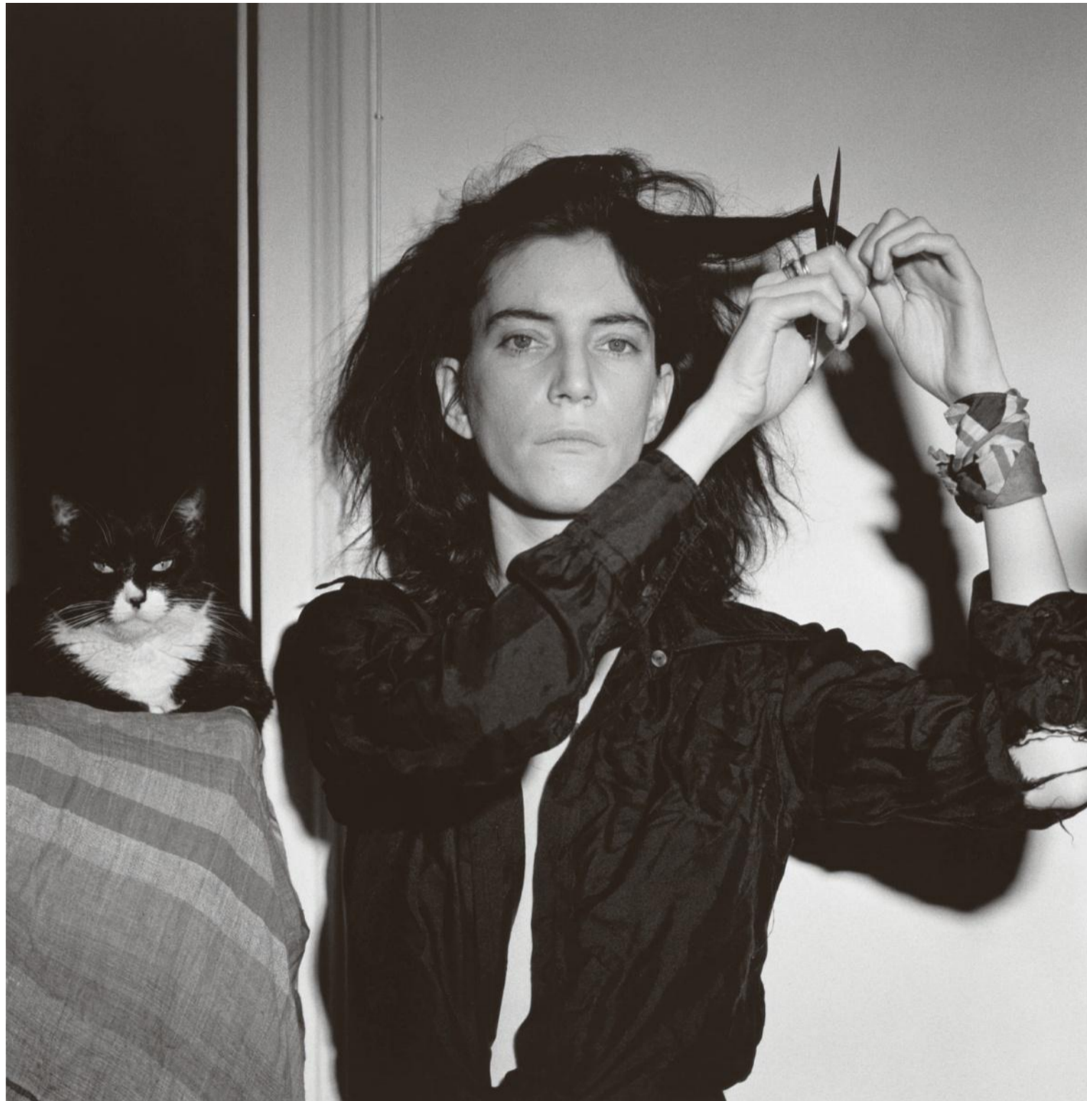
Patti Smith, 1978.