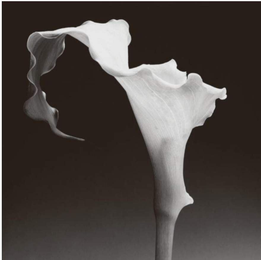
Robert Mapplethorpe, Calla Lily , 1988.