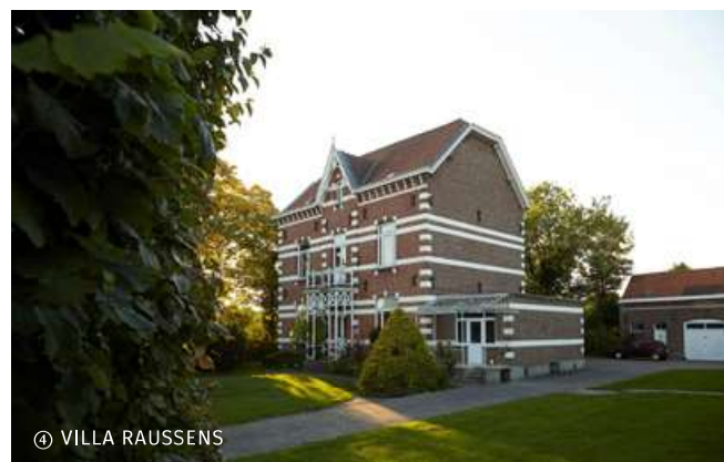
④ VILLA RAUSSENS