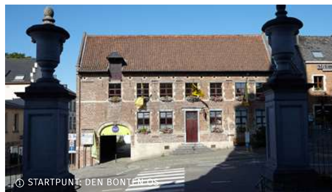
① STARTPUNT: DEN BONTEN OS

De tentoonstelling in bezoekerscentrum Druif leerde je al dat Felix Sohie in 1865 de eerste serres bouwde in Hoeilaart. Dat was het startsein voor een periode van welvaart in de streek. In Overijse trekken de broers