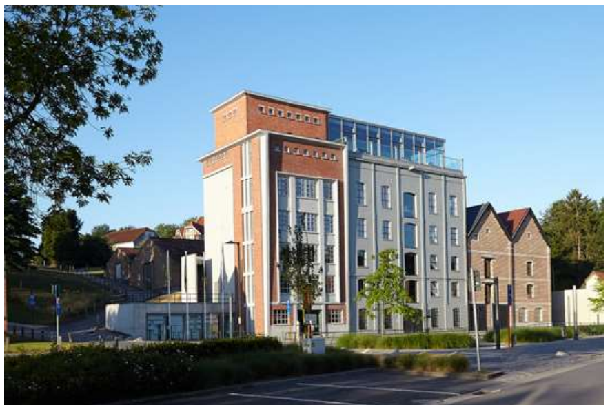
⑭ DE VUURMOLEN

Overijse ligt in het heuvelachtige Dijleland. Omhoog dus weer. Een sympathieke kasseiweg brengt je langs het voetbalstadion ⑮. Boven word je beloond met prachtige panorama's over het Brabantse leemplateau en over het centrum van de gemeente. Je hoge uitkijkpunt biedt je een adembenemend zicht op de zuidgerichte heuvelflank waar ooit honderden druiven-serres blonken in de zon.