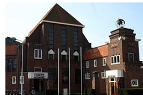
Gebouw Leidsch Dagblad, Leiden