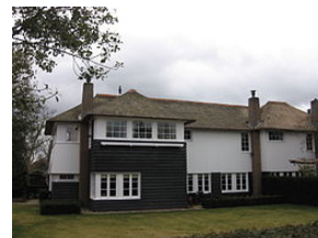
Woning aan de Godelindeweg, Naarden