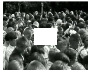
Bioscoopjournaal uit 1931. Opening van het door Dudok ontworpen nieuwe stadhuis te Hilversum.

Zie de categorie Raadhuis van Hilversum ( https://commons.wikimedia.org/wiki/Category:Raadhuis_Hilversum?uselang=nl#mw-subcategories ) van Wikimedia Commons voor mediabestanden over dit onderwerp.