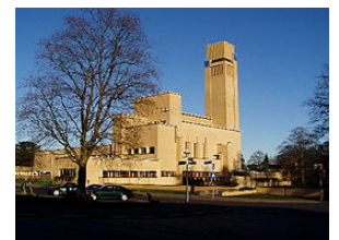
Raadhuis van Hilversum