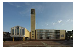
Het Raadhuis van Velsen te IJmuiden uit 1965