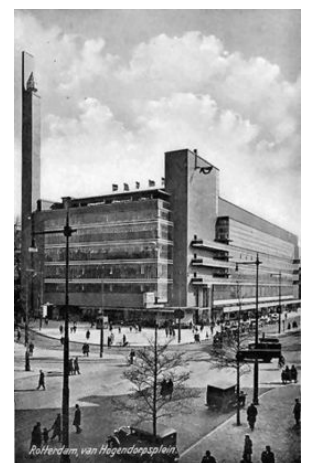
De Bijenkorf van Rotterdam in 1935