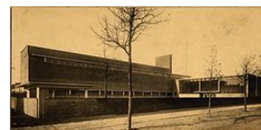
Johannes Calvijnsschool 1930, thans Old School Projects, Hilversum