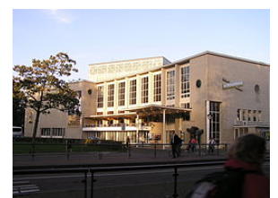
Stadsschouwburg van Utrecht