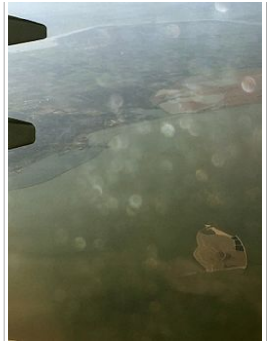
luchtfoto, op de achtergrond Flevoland

Het eerste (en voorlopig nog enige) eilandgebied wordt in totaal zo'n 800 hectare groot (het Markermeer is circa 70.000 ha groot). Het kan in de loop van de tijd doorgroeien tot 10.000 hectare. Ook wordt er dan een onderwaterlandschap met paaiplaatsen, geulen en slinken van ongeveer 1.000 hectare aangelegd. Het is daarmee een van de grootste natuurprojecten van West-Europa. Er worden vaker eilandjes opgespoten om natuurontwikkeling te stimuleren, maar de 'archipel' die de Marker Wadden moet gaan vormen is technisch veel lastiger te realiseren. "Het Markermeer is 4,5 meter diep en de bodem een