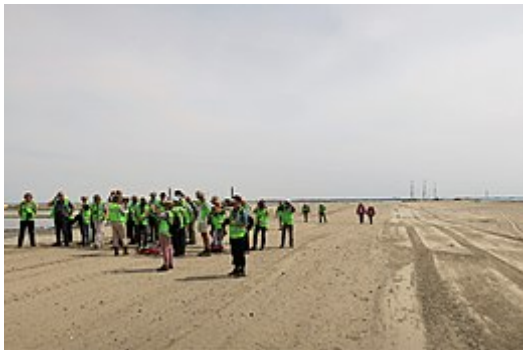
Rondleiding op 12 mei 2018

In 2012 kreeg Natuurmonumenten 15 miljoen euro van de Nationale Postcode Loterij voor het project. Daar kwam begin 2013 een bijdrage van 30 miljoen euro van het rijk bij. Dit bij elkaar maakte het initiëren van het project financieel mogelijk. Voor het daadwerkelijk uitvoeren van het vervolg zocht Natuurmonumenten naar andere (markt)partijen, waaronder de provincie Noord-Holland en de Europese Unie . Ook was er een crowdfunding-campagne . [11] Voor het project is een bestemmingsplan opgesteld, [12] dat op 3 december 2013 door de gemeenteraad van Lelystad werd aangenomen. [13] Er wordt formeel door Natuurmonumenten samengewerkt met Rijkswaterstaat , het Ministerie van Infrastructuur en Waterstaat , het Rijksvastgoed- en Ontwikkelingsbedrijf en het Ministerie van Economische Zaken, Landbouw en Innovatie . Het project werd in mei 2014 opgenomen in de zevende tranche van de Crisis- en herstelwet . [14] Ook liet de Tweede Kamer geld uit het topsectorenbeleid vrijmaken voor het project. [15] Het nieuwe natuurgebied moet een van de projecten zijn die Nederland helpen te voldoen aan de doelstellingen van Natura 2000 .