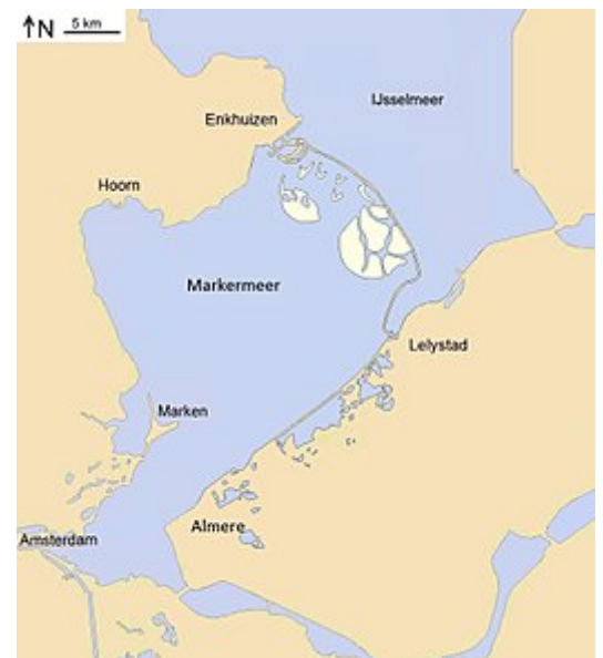
De eilanden bij maximale uitvoering van de plannen