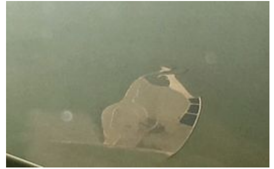
Hoofdeiland, 27 maart 2017

Voor de aanleg is onder meer gebruikgemaakt van het aanwezige bodemslib. Er werd gebaggerd met een snijkopzuiger , waarbij geulen werden gegraven die slib konden opvangen, dat door de stroming van het water naar de juiste plekken wordt geleid, zo nodig met behulp van hydrojetten, een vorm van hogedruk-waterstralen. Er zijn op atollen gelijkende raamwerken gecreëerd, die door middel van compartimentalisatie het slib insluiten om zo een eiland op te bouwen. [5]