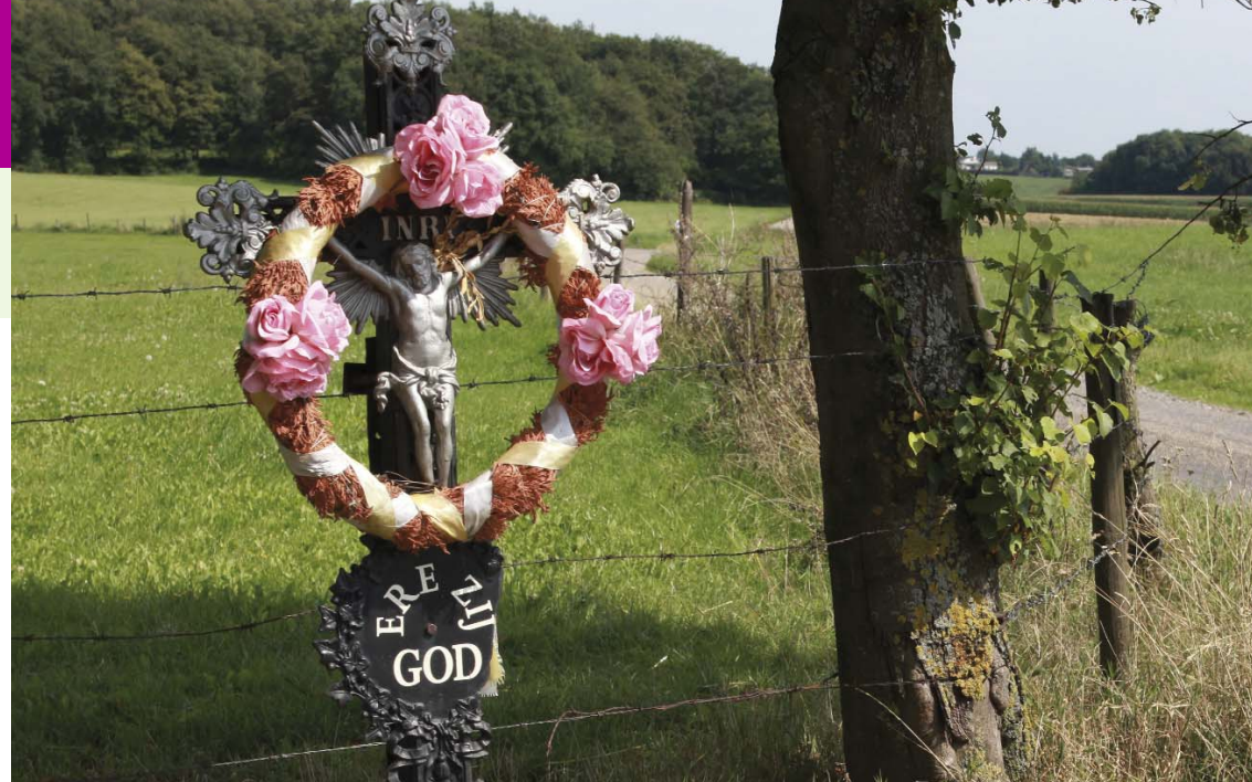
Gietijzeren kruis 24

Dit is een klassiek wegkruis met afbeeldingen van Maria en de apostel Johannes. Dit type komt veelvuldig voor in Limburg. Aan het einde van de 19e eeuw werden deze massaal vervaardigd in de Waalse gietijen in België.