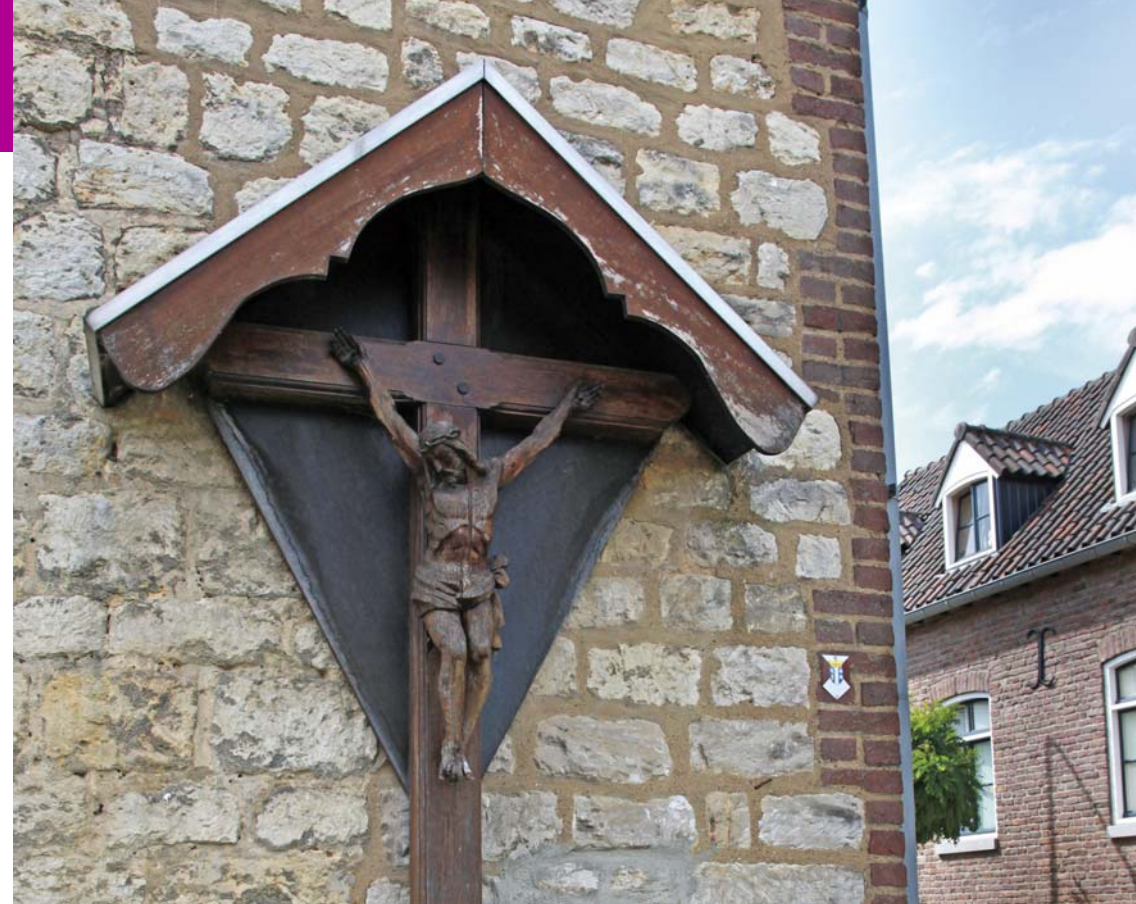
Houten kruis 40

> Op het punt waar de asfaltweg rechtsaf gaat, neemt u het voetpad steeds rechtdoor (langs de beek) door het weiland, langs de waterzuiveringsinstallatie. Dit pad voert u naar een verharde weg. Hier gaat u rechtsaf.