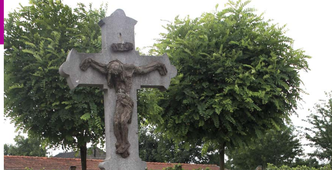
Dankkruis, 1904 ❶

> U loopt aan de linkerkant langs het wegwakruis in zuidelijke richting naar de buurtschap Trintelen (Eyserweg) en volgt deze weg totdat u aan de linkerkant een pleintje met een kruis ❸ en een waterput ziet.