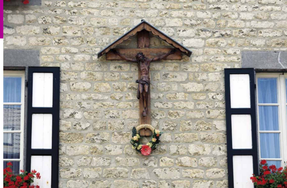
Missiekruis, 1904 7

Direct achter de eerste splitsing staat aan de rechterkant een devotiekruis. 9 Toen in deze buurt in 1994 bijna alle bouwactiviteiten ten einde waren, miste men een devoot plekje, waar ook de sacramentsprocessie even rust kon houden. Dit kruis werd nog datzelfde jaar door de buurtbewoners geplaatst. De tekst luidt: 'Leidsman ten leven'.