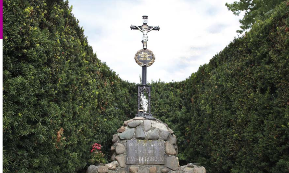
Gietijzeren kruis, 1986 22

Dit is een zeldzaam mooi gietijzeren kruis, vermoedelijk afkomstig van een kerkhof en op initiatief van carnavalsvereniging 'De Bergböck' hier geplaatst in 1986. Het werd op 8 mei van dat jaar ingezegend door pastoor W. Vreuls. De tekst luidt: 'Bron van levend water zegen ons'. Het kruis vervangt een kapel die in de jaren zestig van de vorige eeuw gesloopt werd. De tekst verwijst waarschijnlijk naar de eveneens door 'De Bergböck' in 1981 gerestaureerde waterput aan het pleintje. Deze put ligt 184 m boven NAP en is daarmee Nederlands hoogst gelegen waterput, met een diepte van circa 30 m.