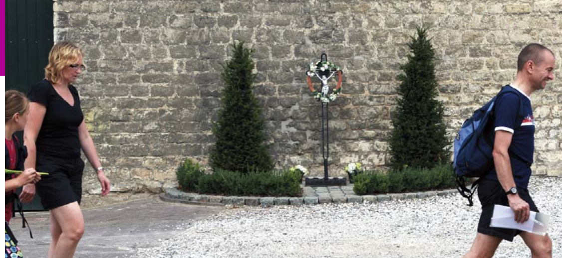
Memorie- of ongeluiskruis, 1930 12

> De doorgaande weg Eys-Simpelveld wordt nu Bulkemstraat. U loopt nu richting de kern van Simpelveld en vervolgt deze weg tot aan de kruising van de Sint Nicolaasbergweg en de Oude Molenstraat.