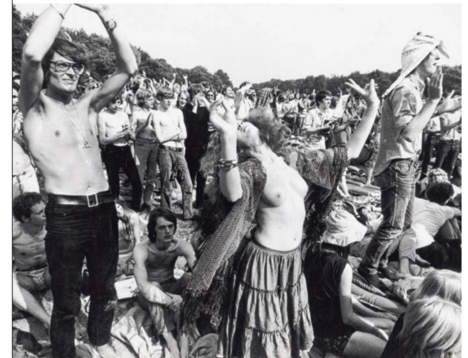
Holland Pop Festival in het Kralingse Bos, 1970.