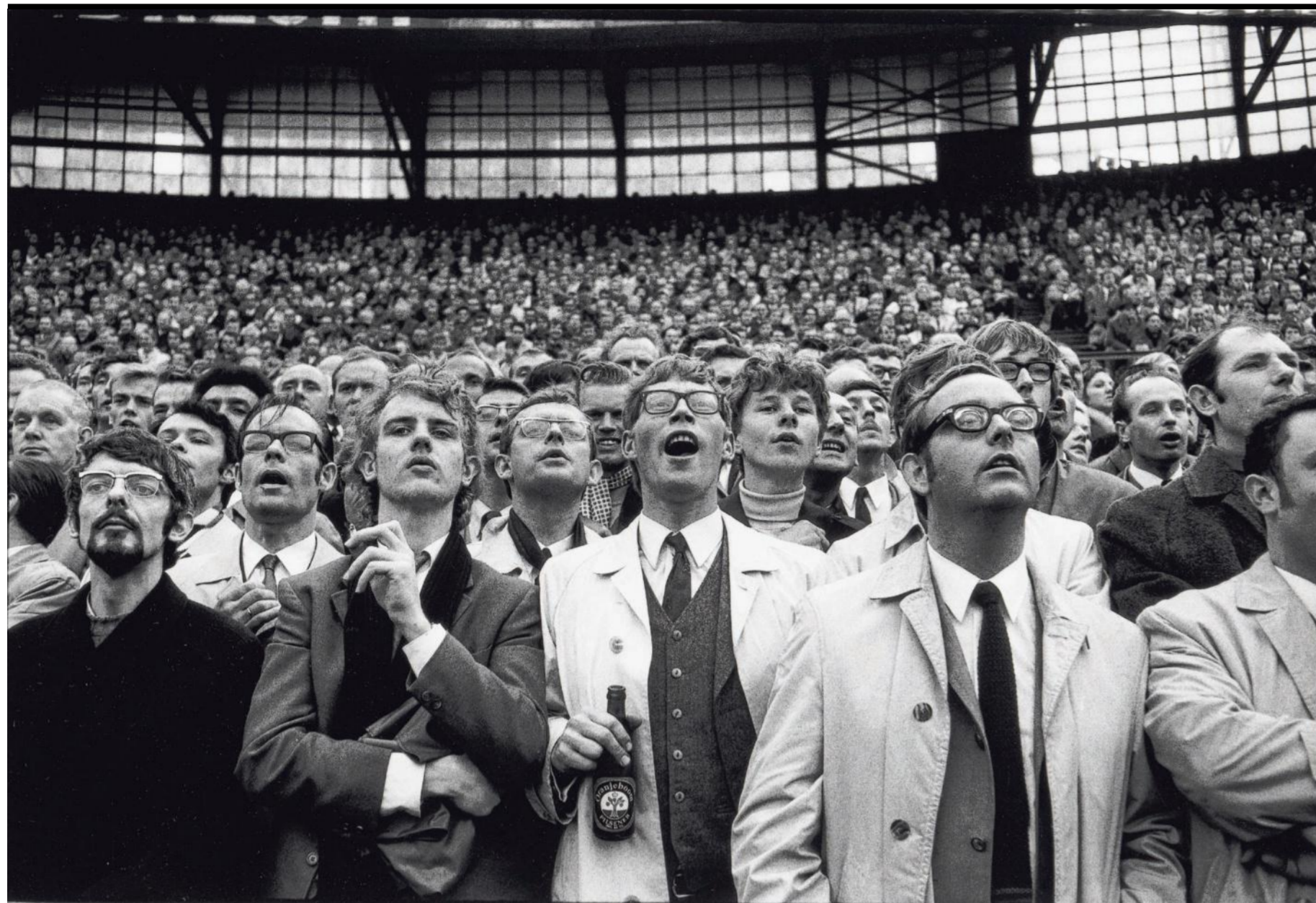
Toeschouwers bij Feyenoord-Ajax in de Kuip, 1969.