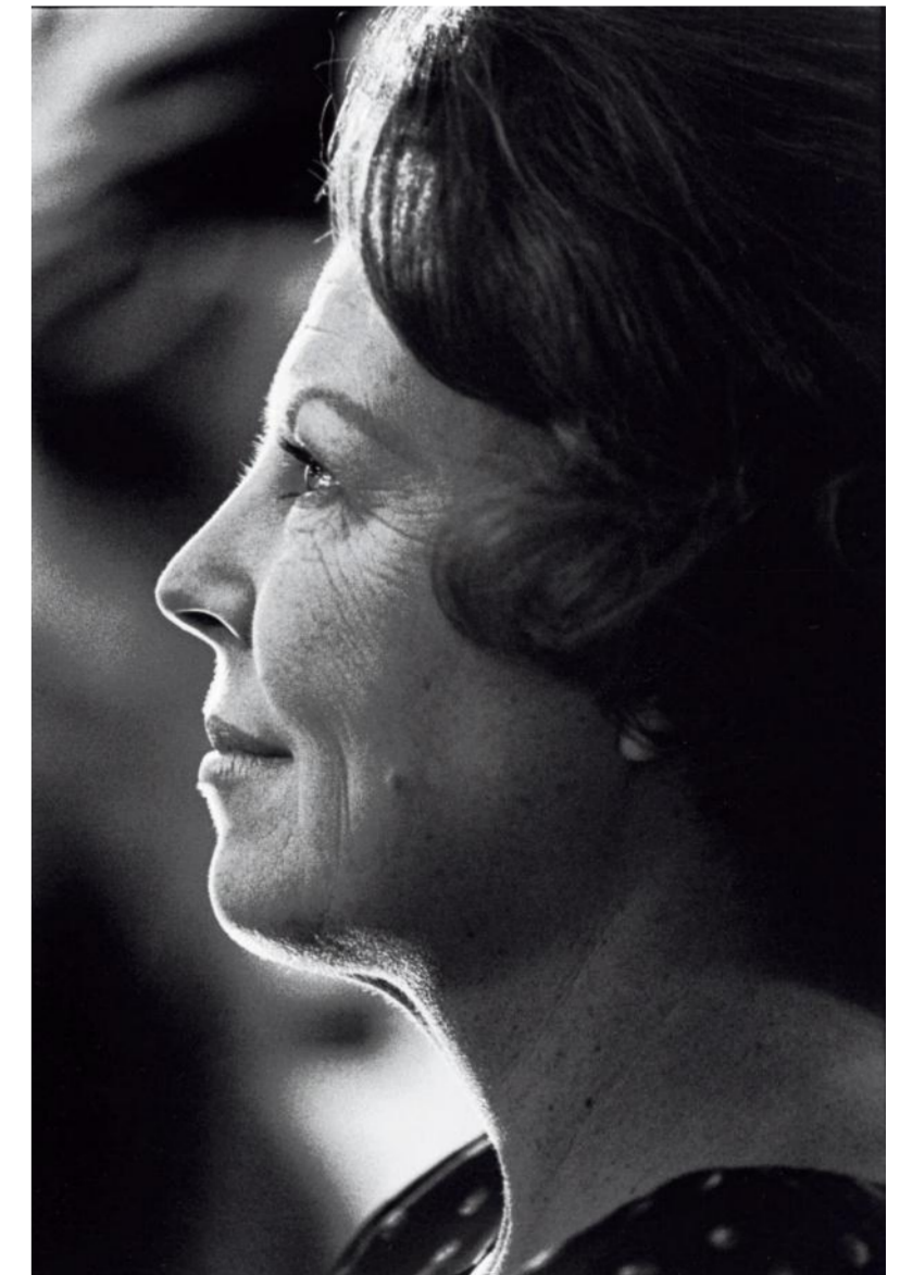
Koningin Beatrix tijdens de fotoshoot voor de Nederlandse Munt, 1980.

●●●●○ Tentoonstelling Vincent Mentzel in het Rijks- museum, t/m 6 juni 2022 rijksmuseum.nl