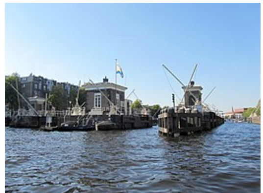
De Amstelsluizen ter hoogte van Theater Carré .