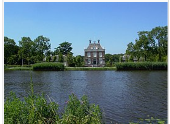
Oostermeer aan de Amstel bij Amstelveen