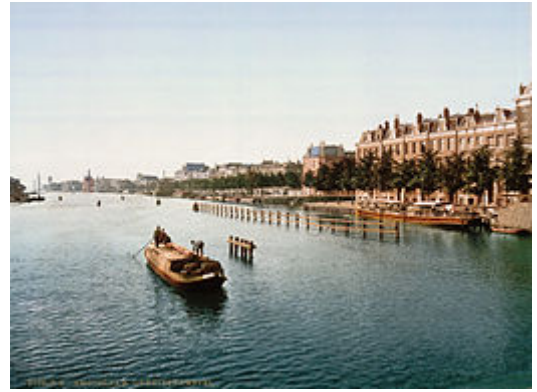
De Amstel gezien in zuidelijke richting vanaf de Hogesluis , omstreeks 1900