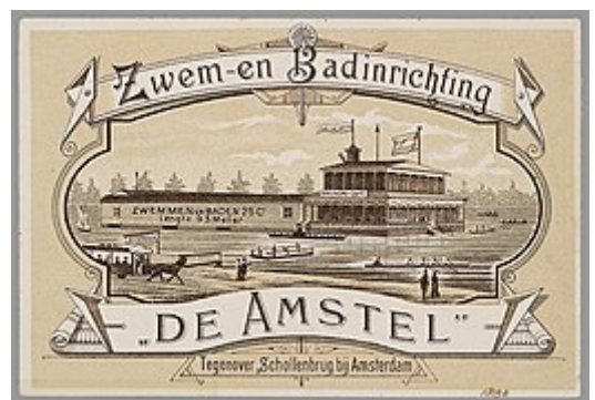
Zwem- en Badinrichting De Amstel, tegenover de Schollenbrug