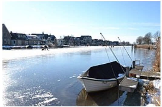
Schaatsers op de Amstel in Uithoorn