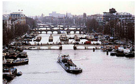
Amstel met Magere Brug .