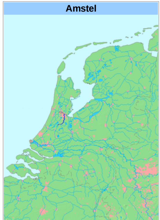
Locatie van de Amstel op de kaart van Nederland

Dit kanaal begint bij de Tolhuissluis bij de samenkomst van de Drecht en het Aarkanaal , iets ten noordwesten van Nieuwveen , en loopt via Uithoorn naar Ouderkerk waar de Bullewijk erin uitmondt. Vanaf daar tot in Amsterdam heet het