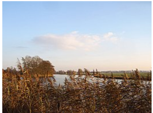
De Amstel ten zuiden van Uithoorn