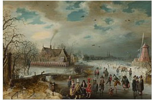
Schaatsers op de bevroren Amstel. Adam van Breen ; 1611.

In de 17e en 18e eeuw stonden er vele buitenverblijven van rijke Amsterdammers langs deze rivier. De meeste hiervan zijn inmiddels verdwenen. Drie oude landhuizen langs de Amstedijk bestaan nog: Amstelrust , Wester-Amstel en Oostermeer . In de Rivierenbuurt zijn naar voormalige buitenhuizen in deze omgeving twee pleinen (en straten) vernoemd: Borsenburgplein en Meerhuizenplein .