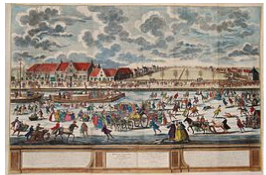
De ijsbreker op de Amstel, ter hoogte van het huidige café De Ysbreker aan de Weesperzijde , op een prent van Pieter Schenk uit 1746