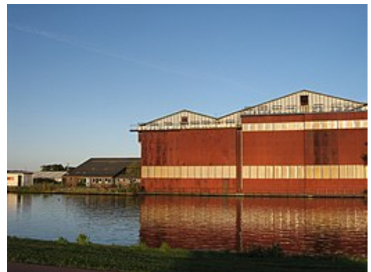
De inmiddels gesloopte Scheepswerf 'de Amstel' op het Amsteleiland , ten zuiden van Ouderkerk in 2009