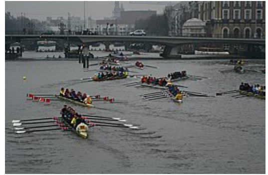
Roeien op de Amstel: Achten wachten op de start van de Head of the River Amstel .

De naam van de wegen en paden langs de oevers hebben verschillende namen en hebben in de stroomrichting van de Amstel gezien de volgende namen: (Zie ook Lijst van straten in Amsterdam )