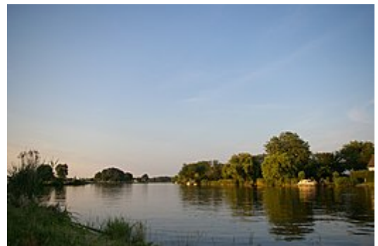
De Amstel bij Nes