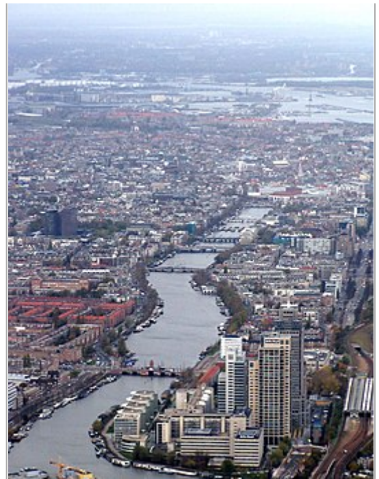
Luchtfoto Amstel bij Amsterdam, gezien van zuid naar noord

Er is een theorie dat de benedenloop van de Amstel voor de twaalfde eeuw anders liep. Door het inklinken van het veen daalde de bodem van het Amstelland en draaide de stroomrichting van de Amstel naar het oosten, om via het Diemermeer een uitweg naar de Zuiderzee te zoeken. Daar was de uitwatering niet optimaal. De veronderstelling dat het deel tussen de Omval nabij het Amstelstation – de plek waar de rivier afboog naar het Diemermeer – en de Blauwbrug gegraven zou zijn wordt door archeologisch onderzoek weerlegd. [1][2] In diepere grondlagen ligt sediment dat wijst op oude rivierafzettingen. [3]