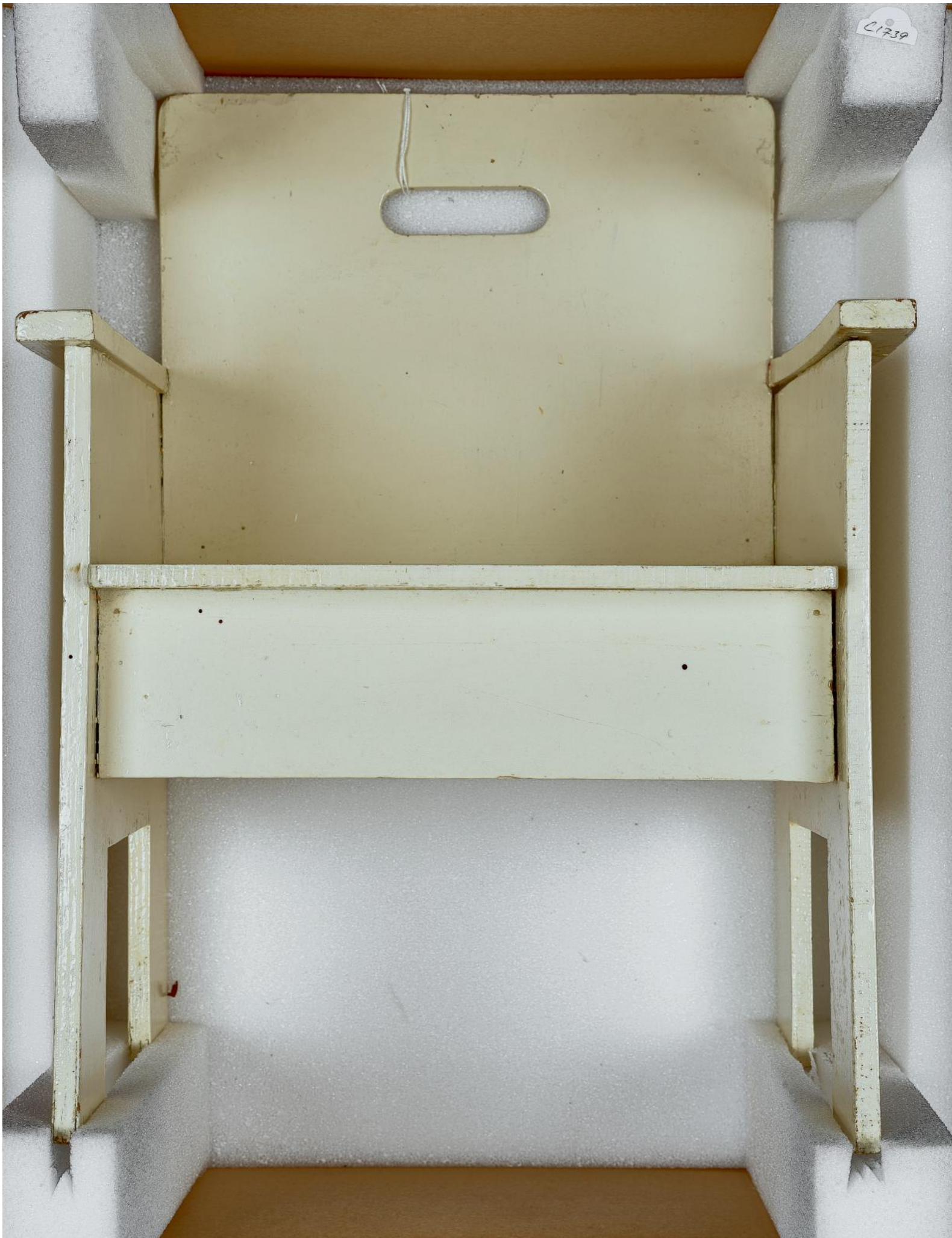
ADO, Montessori-stoel, 1934-1939.