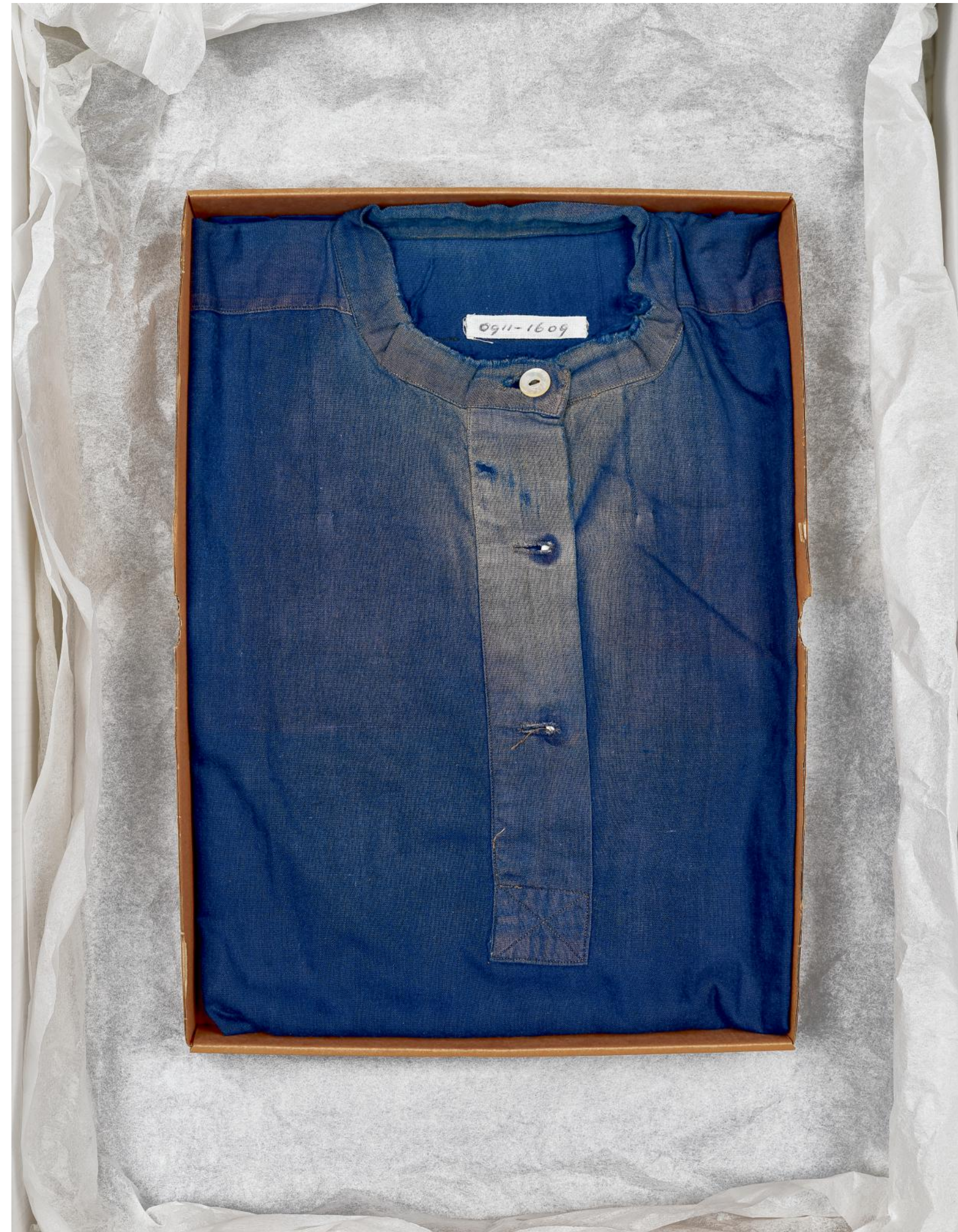
Mannenhemd van blauw katoen, Veluwe streekdracht, twintigste eeuw.