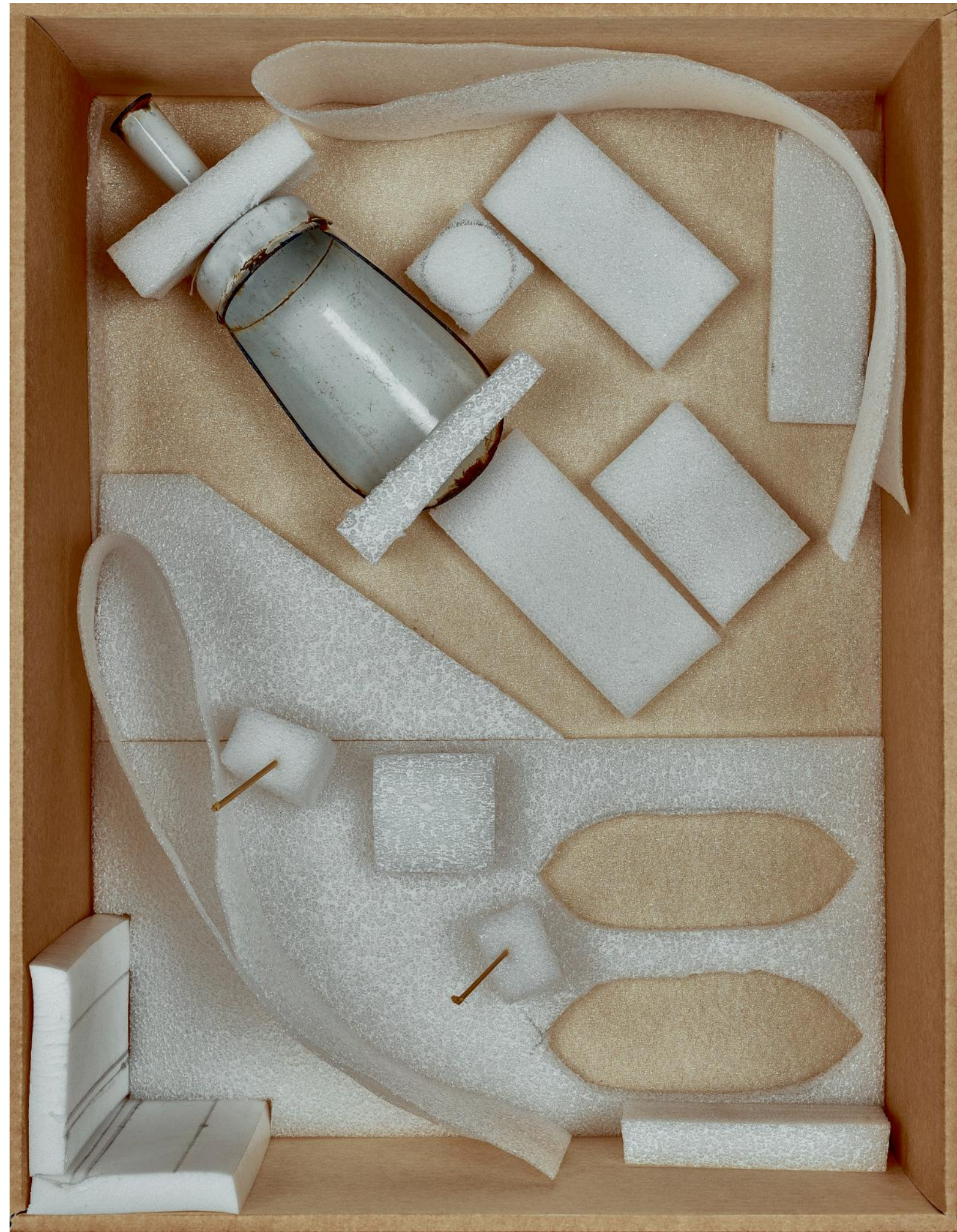
Geëmailleerde levensmiddelen schep, eind jaren dertig.