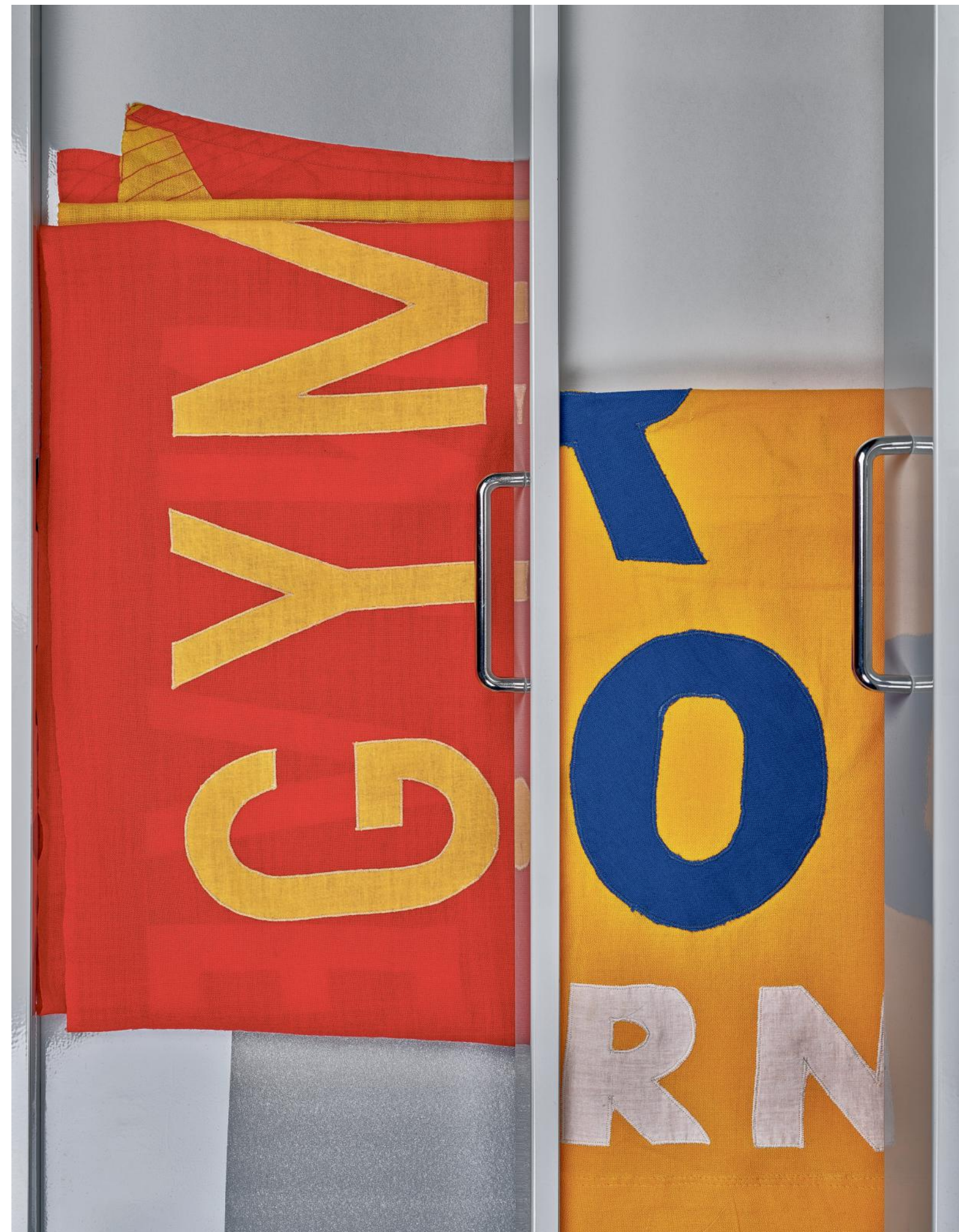
Links een vaandel van de Gymnastiek Vereniging ODILLO Apeldoorn, 1970, rechts vaandel K.V. Apoldro, 1976.

— Scheltens & Abbenes , The Showcase – unboxing the CODA collection . 1 oktober 2022 t/m 15 januari 2023 in het CODA Museum in Apeldoorn