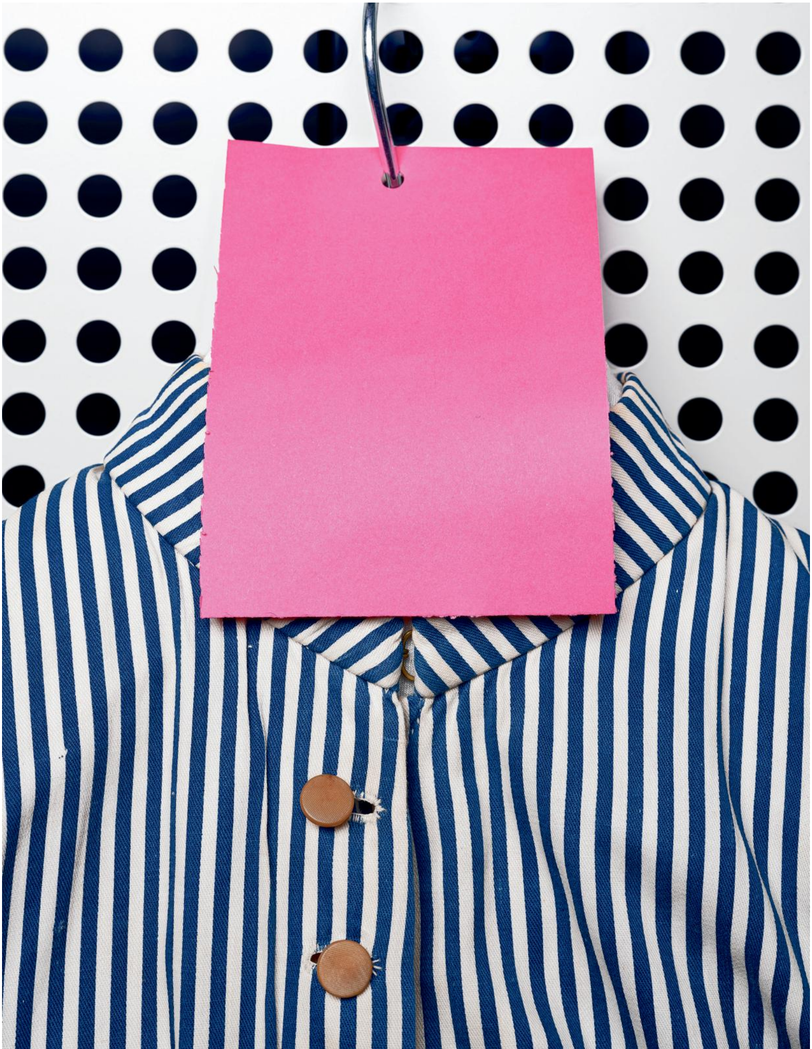
Dienstbode-jak van katoen, eind negentiende eeuw.