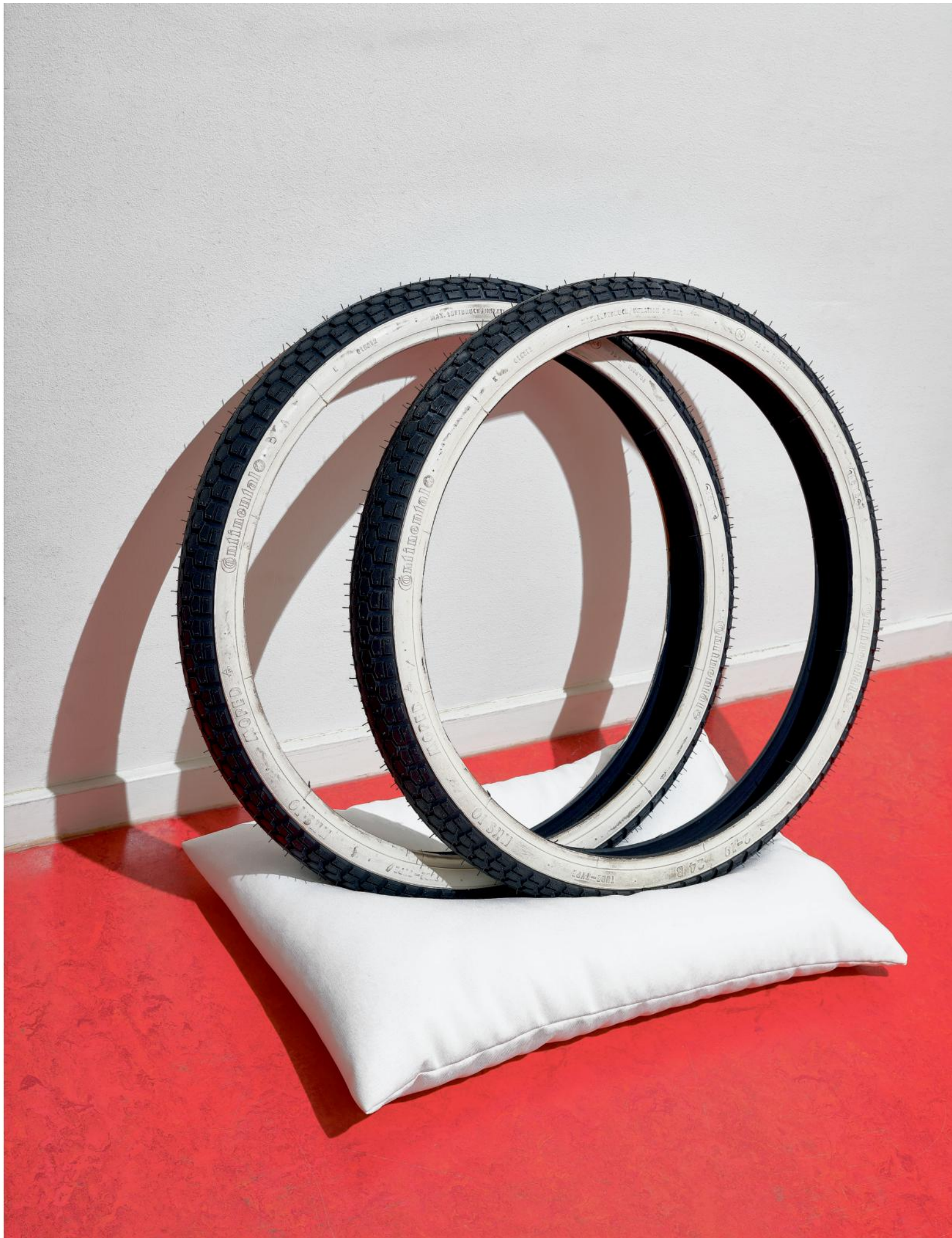
Banden van een Sparta MC 50 verpleegsterbrommer, 1960.