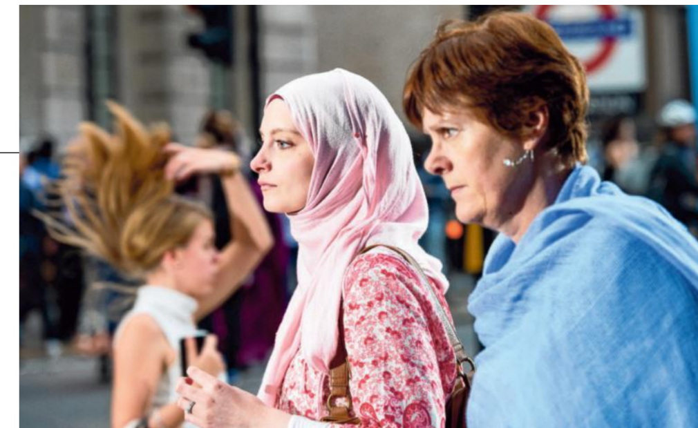
Londen (90x55 cm)